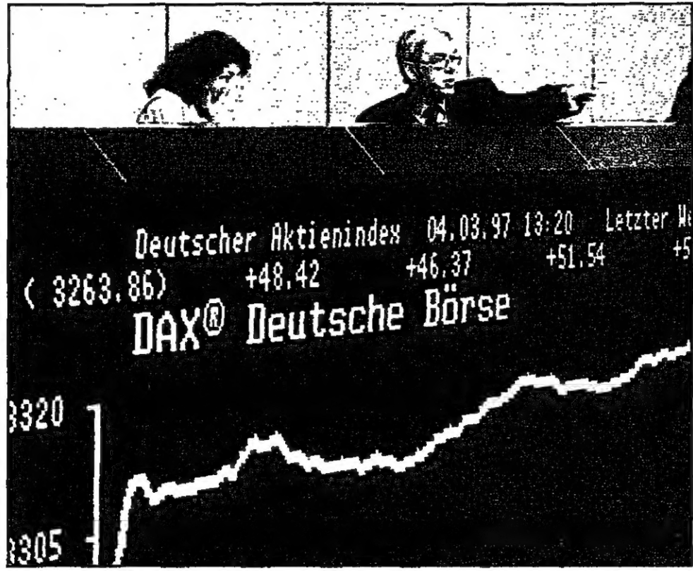
محللون في بورصة فرانكفورت اسعد ان سول مؤشراً مستوى قياسياً جديداً بالارتفاع بقلع قوة الدولار التي تجاوزت 1,77 مارك سايفر للمصيرين اللذان لتزيد من القرض لزيادة صادراتهم

وعمل محلي يوتي شخص من شركة المساهمة التي تزيد عن خمسة ملايين شخص في أكثر من 400 شركة تابعة للقطاع العام الذي لم يحقق نجاحاً الا في قطاع النفط والغاز الذي حقق 94 في المئة من دخل العملات الاجنبية او ما يتجاوز 12 مليار دولار العام الماضي. ويتابع عمله حيثما وجد وضع تصور بما يريدون ان يجمعوا عليه بعد خمس سنوات على ان يواصلوا التحرك باتجاه تحقيق هذه الغاية.